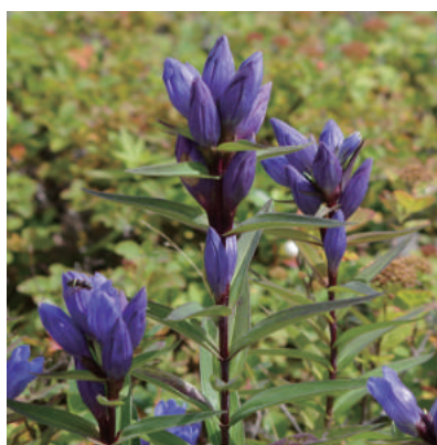
山でしか見ることができない 花や植物たち