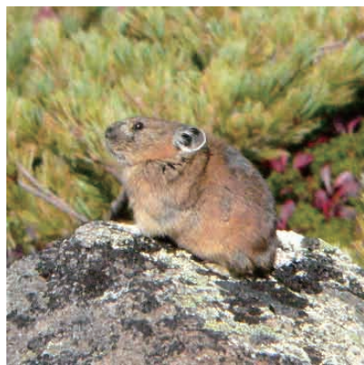
北海道だけに生息する ナキウサギ