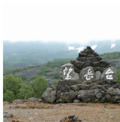
十勝岳と上富良野を一望できる 望岳台